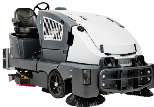
A kép illusztrációként szolgál.

Ezzel a technológiaváltással sok pénzt takarít meg a csökkentett karbantartási költségek miatt.